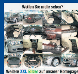
Weitere XXL Bilder auf unserer Homepage.