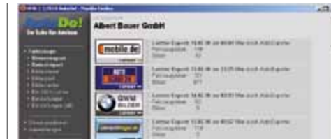
Übertragung zur Gebrauchtwagenbörse jederzeit auch manuell möglich

Die Nutzung der neuen webbasierten Fahrzeugakte ist im AutoDo!-System AMO bereits mit der Buchung des Grundpaketes AMObasis! möglich. So können alle in AMO erzeugten PDF-Dokumente, wie Angebote, Kaufverträge und Preisschilder, automatisch in der Fahrzeugakte hinterlegt und eingesehen werden. Zusätzlich können manuell und/oder automatisch generierte Verlinkungen zu Dateien oder